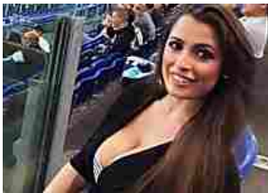
"Se ci salviamo mi spoglio"