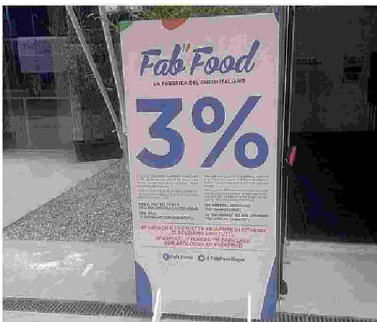
CANTIERE In alto, una foto dei lavori allo stand di Confindustria dello scorso 4 maggio. Sotto, il cartellone all'ingresso