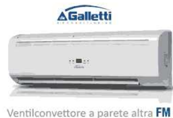
Ventilconvettore a parete altra FM