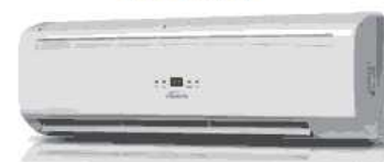
Ventilconvettore a parete altra FM