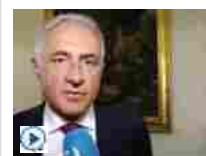
Autorità Energia: tuteleremo