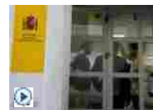
La Spagna torna alle urne, il nodo principale