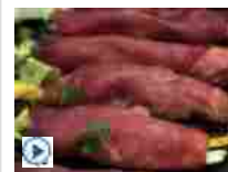
Bresaola della Valtellina, un salume