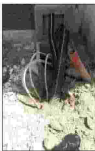
Impianti svuotati dal rame

Illustrati, nel corso dell'evento, anche i risultati dell'"Action day", svoltosi il 27 maggio scorso nell'ambito di Europol e promosso quest'anno proprio dall'Italia che, grazie alle competenze acquisite negli anni, collabora con diversi