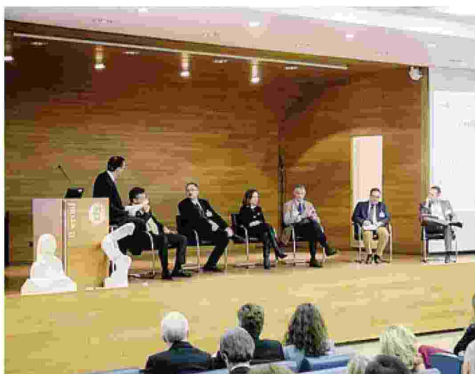
La tavola rotonda tenutasi al Fimi