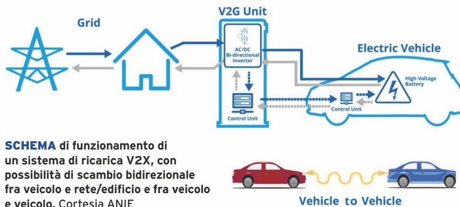
SCHEMA di funzionamento di un sistema di ricarica V2X, con possibilità di scambio bidirezionale fra veicolo e rete/edificio e fra veicolo e veicolo.

«AUSPICO SCELTE VISIONARIE DEI REGOLATORI PER UNA CORRETTA REMUNERAZIONE DEI SERVIZI RESI CON LA TECNOLOGIA V2G, CHE COMPENSINO IL CONSUMO DELLE BATTERIE DEI VEICOLI. QUESTO FAVORIRÀ UNA RAPIDA DIFFUSIONE DEI VEICOLI ELETTRICI E DELLE UVA (UNITÀ VIRTUALI ABILITATE), E CONSENTIRÀ LA PRESENZA IN RETE DI UNA ELEVATA QUOTA DI RINNOVABILI CON INNEGABILI VANTAGGI ECONOMICI ED AMBIENTALI».