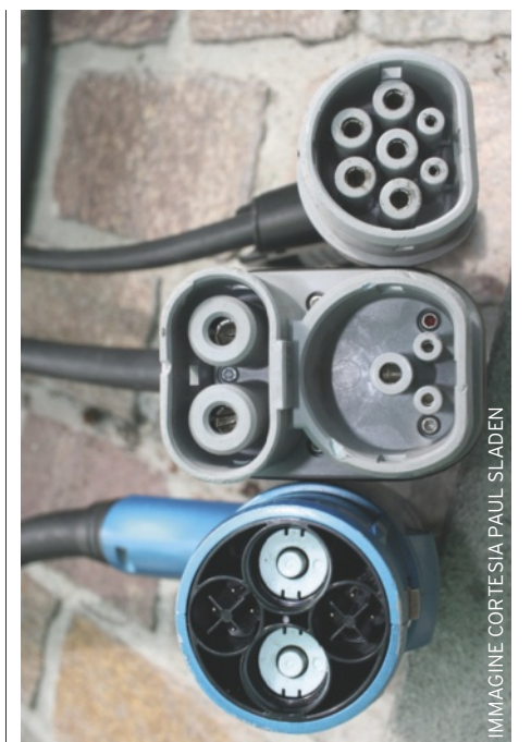
I TRE CONNETTORI utilizzabili nelle aree pubbliche in Europa: Tipo 2 (sopra), CCS System Combo2 (al centro) e CHAdeMO (sotto).