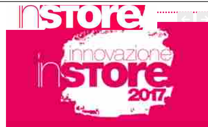
Innovazione InStore, parte l'edizione 2017