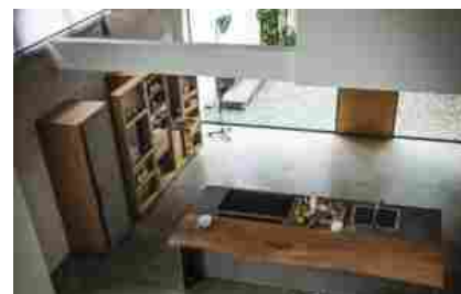
Riva 1920, un'azienda fondata sulla passione per il legno