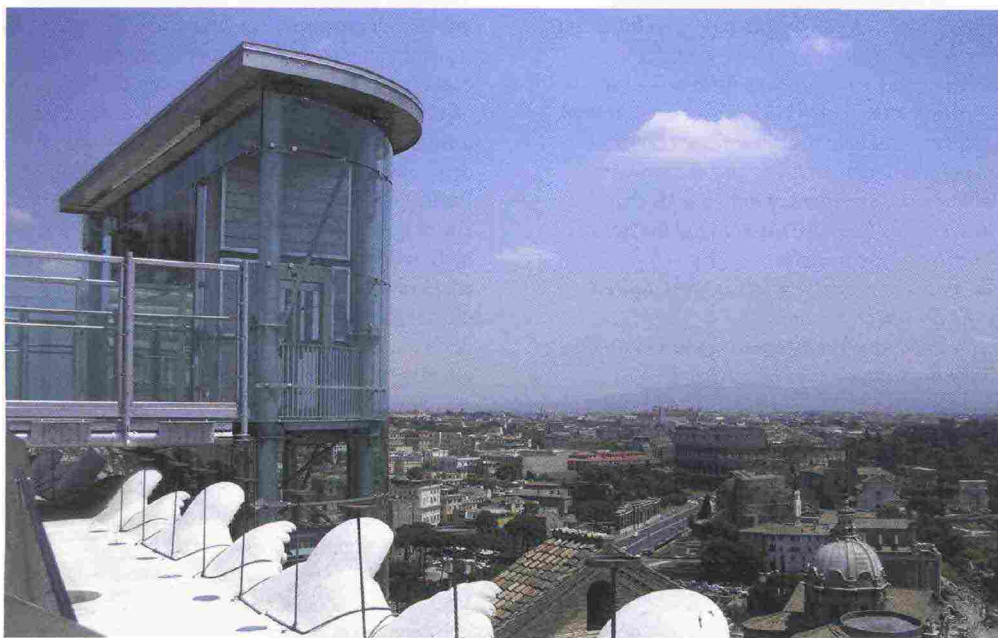
The Vittoriano lift in Rome • L'ascensore del Vittoriano a Roma

Ancora più in là si è spinta la città di New York, che ha reso pubbliche le informazioni relative al proprio parco ascensoristico urbano (76.000 impianti fra ascensori e scale mobili): chiunque connettendosi al sito web dedicato 4 accede a un’ open database che contiene informazioni dettagliate in merito a ogni singolo ascensore operante (portata, lunghezza della corsa, velocità, incidenti segnalati, ecc.).