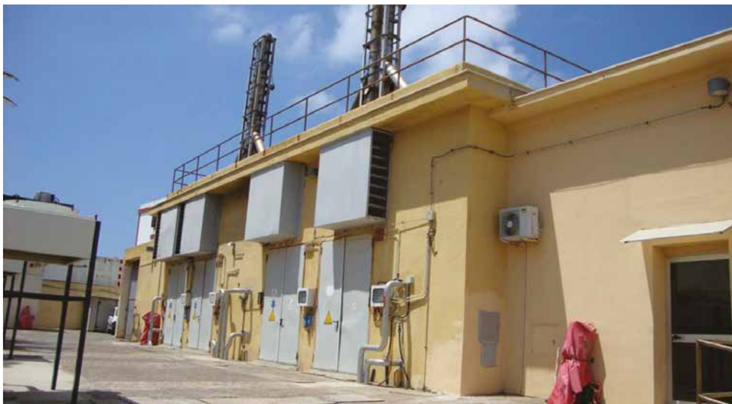
■ Il distributore ha voluto ottimizzare l'esercizio elettrico nell'isola di Ventotene tramite l'installazione di un sistema di accumulo con batterie a ioni di litio di 300 kW e 600 kWh

I sistemi di accumulo possono essere impiegati per la fornitura di servizi molto diversi, alcuni dei quali richiedono "prestazioni in potenza" (o "Power Intensive"), quindi sistemi in grado di scambiare elevate potenze per tempi brevi (da frazioni di secondo a qualche minuto), mentre altri richiedono "prestazioni in energia" (o "Energy Intensive"), ovvero sistemi in grado di fornire potenza con autonomia di parecchie ore.