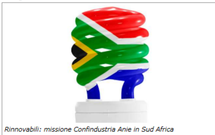
Rinnovabili: missione Confindustria Anie in Sud Africa

Il Sud Africa lancia un nuovo piano per lo sviluppo, con un ruolo notevole per le rinnovabili: degli 84 miliardi di investimenti già stanziati per i prossimi tre anni, 30 andranno al settore energetico