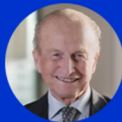
Il Presidente Maurizio Sella

“ Crescere avendo un impatto positivo è la strada maestra che vogliamo continuare a seguire, non possiamo prescindere da una crescita sostenibile. Le aziende per avere successo devono creare valore per la società in cui operano e lo possono fare solo se cambiano e si adattano ai cambiamenti generali del mondo. Darsi degli obiettivi sostenibili da parte di un'impresa, del resto, non è solo qualcosa di "buono" da fare, ma è diventata un vera e propria necessità economica. ”