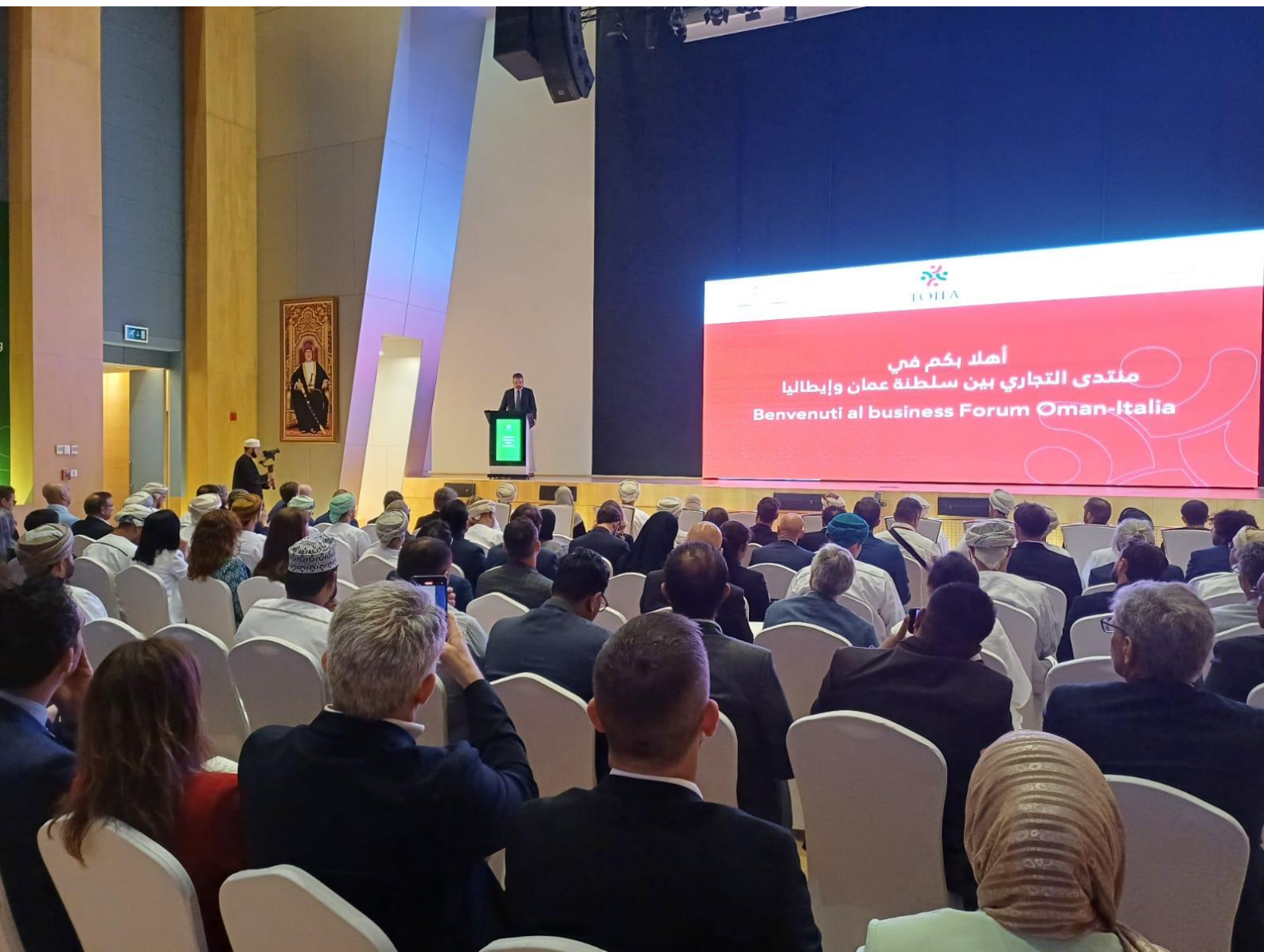
Business forum Italia-Oman, 28 aprile 2024, a “InvestOman”